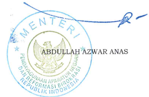
ABDULLAH AZWAR ANAS

MENTERI PENDAYAGUNAAN APARATUR NEGARA DAN REFORMASI BIROKRASI REPUBLIK INDONESIA,